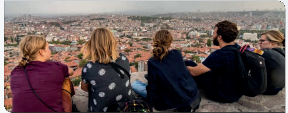
Udsigten over Ankara nydes sammen med en kristen tyrker

At være kristen i Danmark er for mig en kæmpe velsignelse. Jeg har gode kristne venner, et stort kristent fællesskab og en familie at være fælles om troen med. Derudover er der et utal af fede kristne tiltag, kristne skoler, efterskoler og bibelskoler, hvor jeg kan udvikle min tro og lære Gud bedre at kende. Vi er et velsignet land, men lad os ikke glemme at takke Gud og glæde os over det, som alle kristne på tværs af kulturer og landegrænser har tilfælles at takke for, nemlig frelsen.