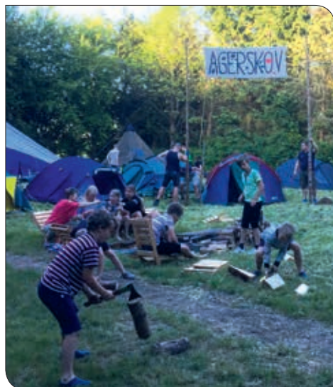
Juniorene hygger sig med forskellige aktiviteter

At gå rundt på pladsen på Haderslev Næs og høre summen af ca. 100 glade mennesker, sang, vandpjask og duften af den lækre mad eller de lidt for brændte snobrød giver en god følelse af sommer, hygge og varme. Det er en fantastisk måde at være sammen med sine juniorer på. Der er tid til at snakke sammen, være noget for hinanden og lære hinanden bedre at kende. Den tid, man bruger