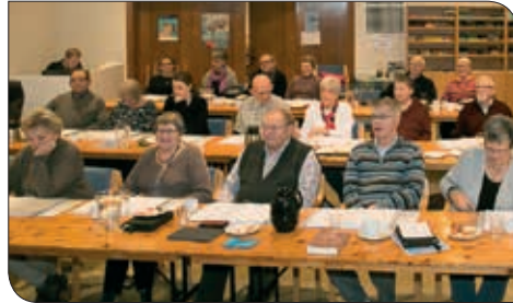
LM i Sønderborg har i løbet af vinteren haft et kristendoms kursus