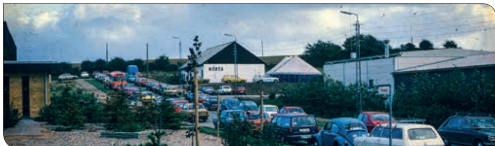
Fra indvielsen af Norea-huset

Somalia er et af de steder i verden, hvor det er sværest at leve som kristen. Islam står meget stærkt i landet. Det har været præget af borgerkrig og interne konflikter gennem mange år, og ikke mindst børnene er store ofre i sådanne langvarige konfliktzoner. Ingen eller meget lidt