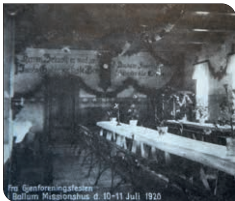
Fra Genforeningsfesten Ballum Missionshus d. 10-11 Juli 1920

Foreningen oplevede omkring århundredskiftet vækst i antal og åndelig indsigt i store dele af det dansktalende Slesvig. "Den jævne, enfoldige Forkyndelse af Synd og Naade har baaret velsignede Frugter, som først Evigheden til fulde vil aabenbare" (mindeskrift 1868-1918). I året 1914 var der ca. 80 mødepladser, hvor Guds ord regelmæssigt forkyndtes og medlemstallet øgedes. 11 prædikanter og 2 kolportører var nu kaldet til at prædike Guds Ord, men krigen 1914-18 var en ikke ubetydelig hindring for foreningens arbejde, idet flere af dens medarbejdere blev indkaldt til krigstjenesten bl.a. Johs.