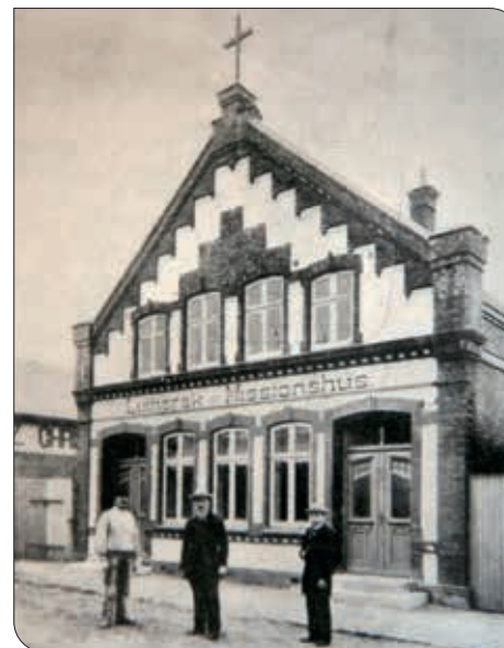
Skærbæk missionshus (Mindeskrift 1868-1918)