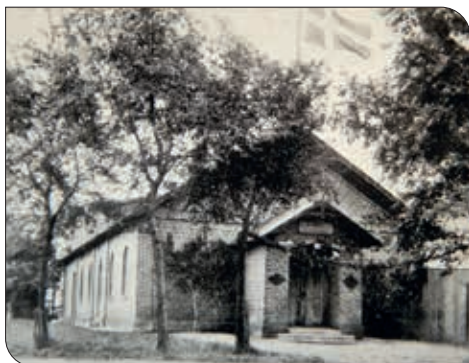
Ballum missionshus (Mindeskrift 1868-1918)