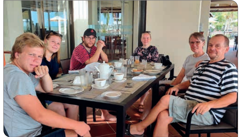
I julen 2019 havde vi besøg af alle vore børn.

få valide oplysninger om, hvor alvorlig situationen er med smittetrykket her i landet, men det ser ud til, at TZ er sluppet nådigt, når vi ser på forholdene rundt i hele verdenen. Vi er taknemlige for, at vi indtil nu ikke har været ramt af corona hverken blandt kollegaer, volontører eller DLM/Soma Biblia ansatte.