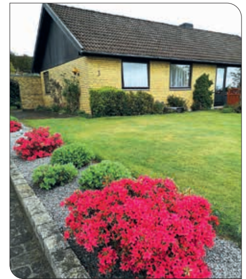
"Her kan jeg føle mig hjemme," var Ingeborgs første tanke, da hun kom ind i huset.