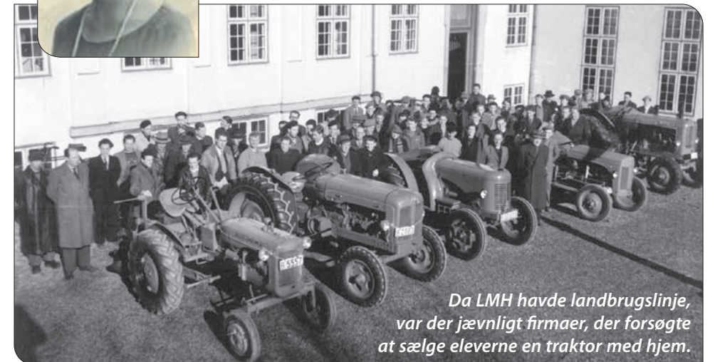
Da LMH havde landbrugslinje, var der jævnligt firmaer, der forsøgte at sælge eleverne en traktor med hjem.