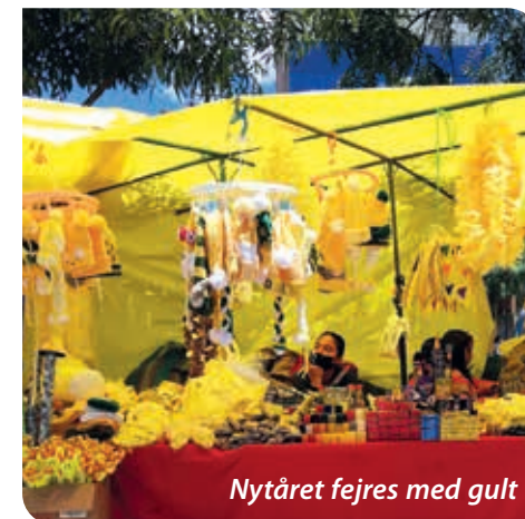
Nytåret fejres med gult

Selvom det for os har været en stor opmuntring at se seks nye personer til gudstjeneste i Cusco de seneste to måneder, så er det et budskab, vi håber og beder til, at stadig flere må få lov at høre. En kvinde fra kirken fortalte om en samtale, hun havde overhørt ved en bod, der op til nytår solgte diverse ting i gult. Gult undertøj, gule hatte, gul konfetti til at strø om huset mv. som efter sigende bringer