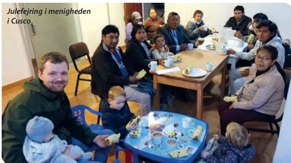
Julefejring i menigheden i Cusco