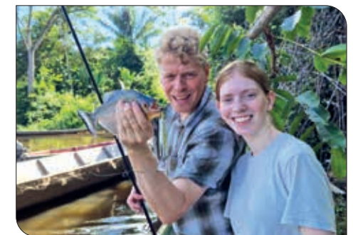
Vi fangede alverdens glubske tropiske fisk