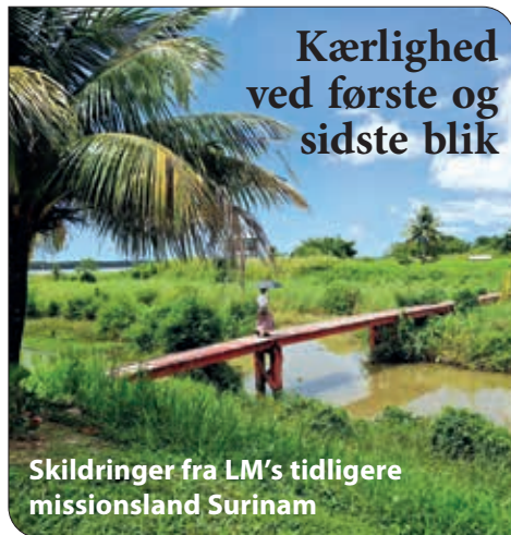
Skildringer fra LM's tidligere missionsland Surinam

"Når du er ramt af sygdom, helbredelsen udebliver, og du måske ikke har langt igen. Når du er alene og ensom og ikke ved dine levende råd. Så se til højre, for dér, lige hos dig, er den ven, der aldrig forlader dig."