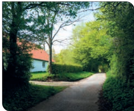
Sundeved Centret danner ramme for den kommende retræte.

En retræte vil derfor typisk både være et ophold med begrænset program, og punkter, som lægger op til eftertænksomhed. I en kristen sammenhæng handler det også om åndelig fornyelse og/