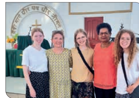
Fra Soesamatjaar kirken i Paramaribo

Surinam er i en urolig tid. Politisk er der ustabilitet. Inflationen det sidste år er blandt de fem højeste i verden. Mange