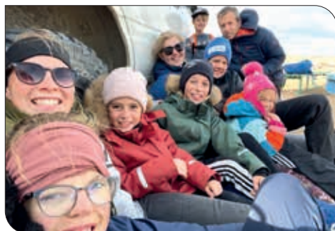
Den norske skole