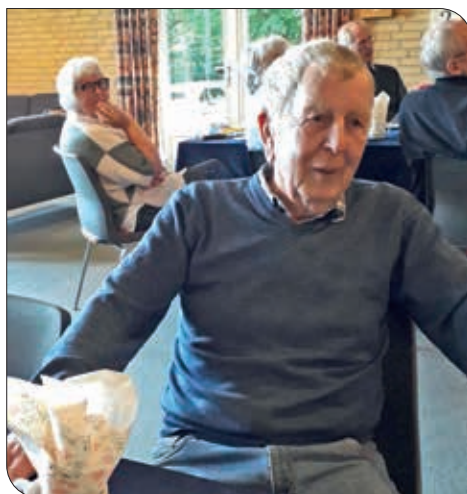
Ole har altid været glad for den opgave, han fik på Solbakken.